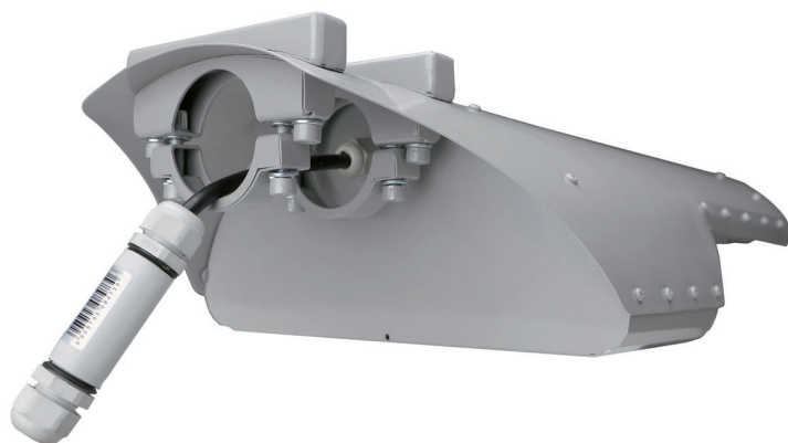
Sposób mocowania lampy